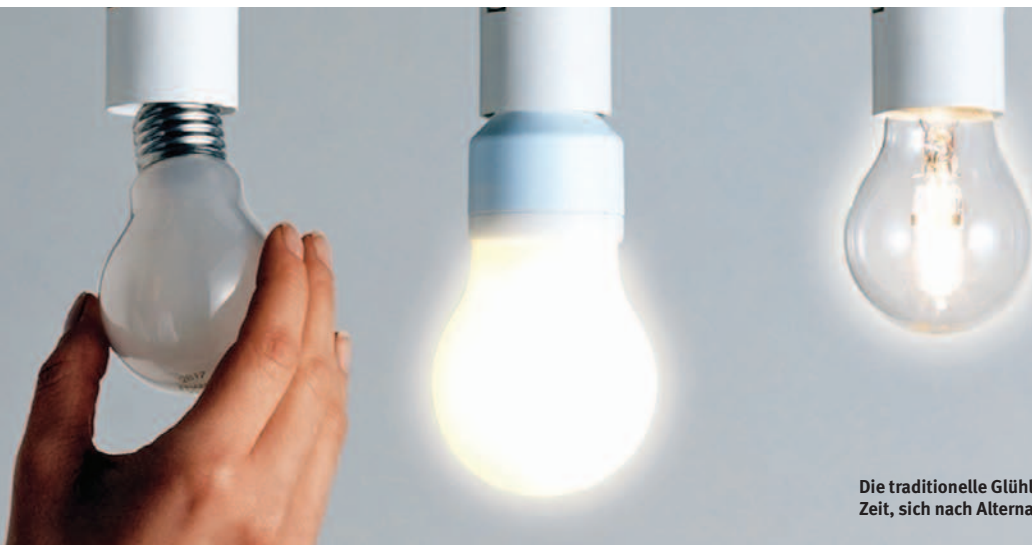
Die traditionelle Glühlampe hat bald ausgedient. Zeit, sich nach Alternativen umzusehen.

Traditionelle Glühlampen sind ab nächstem Jahr nicht mehr zulässig. Dann müssen auch Liegenschaftsbesitzer bei der Beleuchtung von Aussenraum und Erschliessung umdenken. Stromsparlampen, Eco-Halogenlampen und LED-Leuchten bieten sich als ökologischere Alternativen an und ermöglichen ganz neue Lichteffekte. Was es dabei zu beachten gilt.